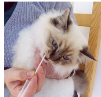
Probennahme bei der Katze